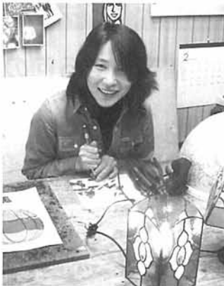
「作り上げた達成感がたまらない」という

年、独り立ち。アトリエでの製作、販売とカフェでの展示即売。教室も開き、主婦やOL、男性三人を含む